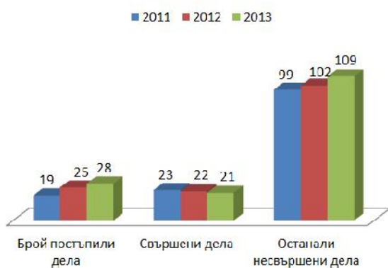
Брой изпълнителни дела в РС Ардино