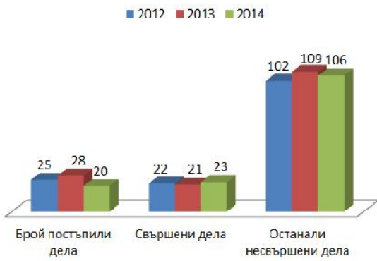
Брой изпълнителни дела в РС Ардино